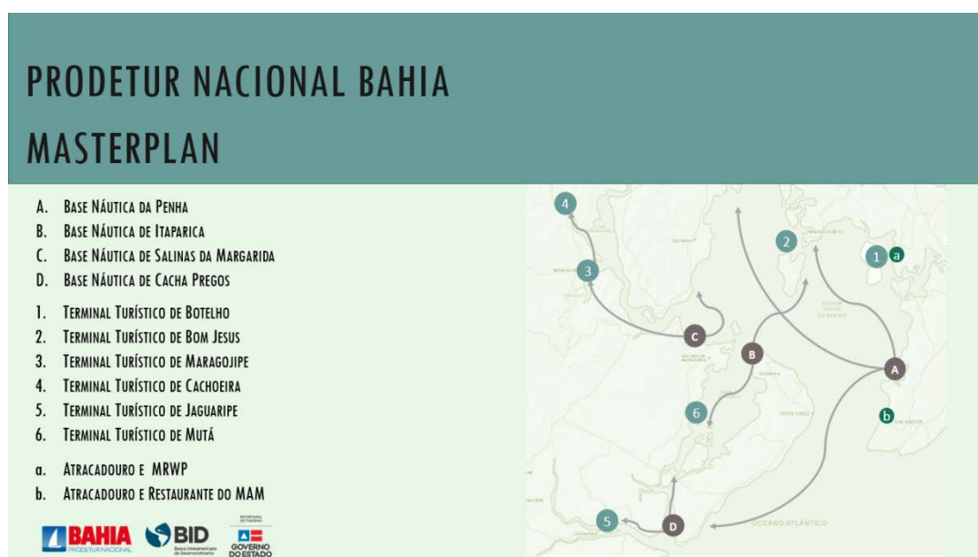
Figura 2: Mapa das bases, terminais e atracadouros – segmento náutico BTS

Toda a distribuição do fluxo de turistas na BTS está sendo direcionada para a utilização das infraestruturas náuticas como terminais, marinas e atracadouros, como: as Marinas da Penha, localizada em Salvador e de Itaparica, além de criar duas estruturas, uma em Salinas da Margarida e a outra em Cacha-Pregos – Vera Cruz.